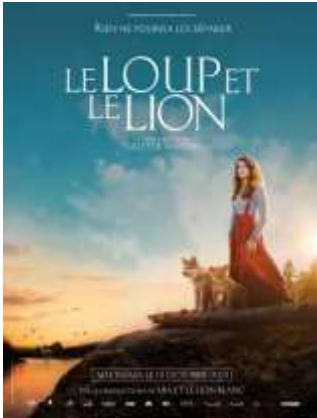
Aventure - Famille - 1h39