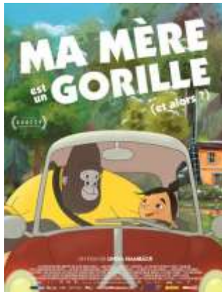
Animation - Famille - 1h12

Ce que souhaite Jonna par-dessus tout, c'est de trouver une famille adoptive... elle accepterait n'importe quel parent qui puisse lui donner de l'amour. La surprise est de taille lorsqu'une femelle gorille se présente un jour à l'orphelinat pour être sa nouvelle maman !