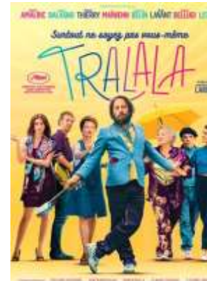
Comédie musicale - 2h00

Tralala, la quarantaine, chanteur dans les rues de Paris, croise un soir une jeune femme qui lui adresse un seul message avant de disparaître : "Surtout ne soyez pas vous-même". Tralala a-t-il rêvé ? Il quitte la capitale et finit par retrouver à Lourdes celle dont il est déjà amoureux. Elle ne se souvient plus de lui. Mais une émouvante sexagénaire croit reconnaître en Tralala son propre fils, Pat, disparu vingt ans avant aux Etats-Unis. Tralala décide d'endosser le "rôle". Il va se découvrir une nouvelle famille et trouver le génie qu'il n'a jamais eu.